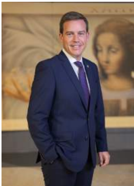
Roger Cerdà i Boluda Alcalde de Xàtiva.