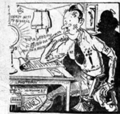
El dibujo de Cipote. — 1934. España. Reproducción autorizada por el autor. Se trata de un dibujo que ilustra una situación general, pero no se refiere a las circunstancias.

Llegamos a la santa casa a las doce en punto de la mediana.