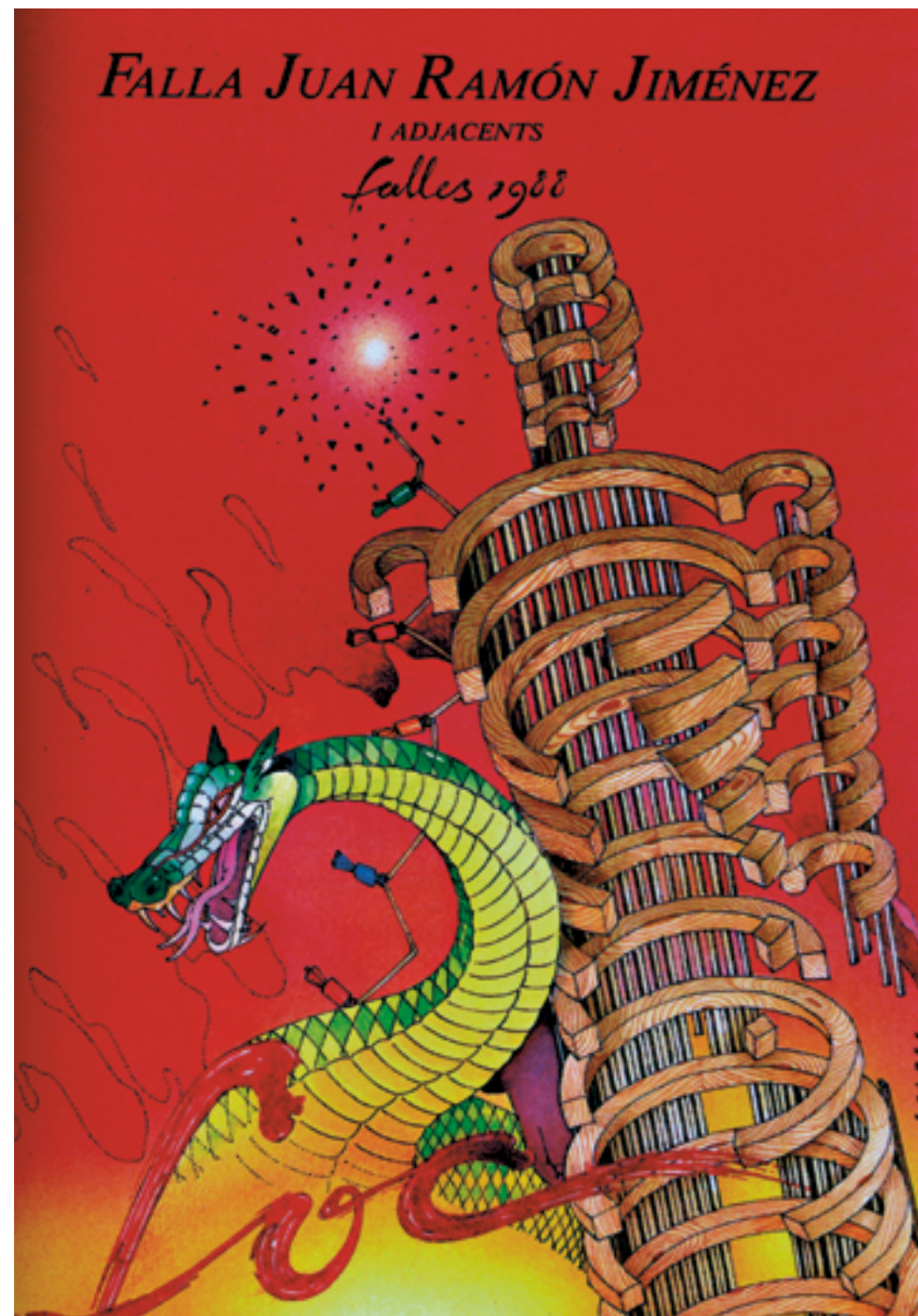
Portada d'Enric Solbes ▲