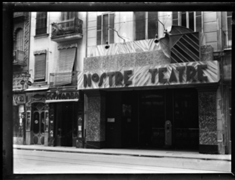
▲ El Nostre Teatre al carrer Pi i Margall, actual carrer Russafa de València, en 1934.