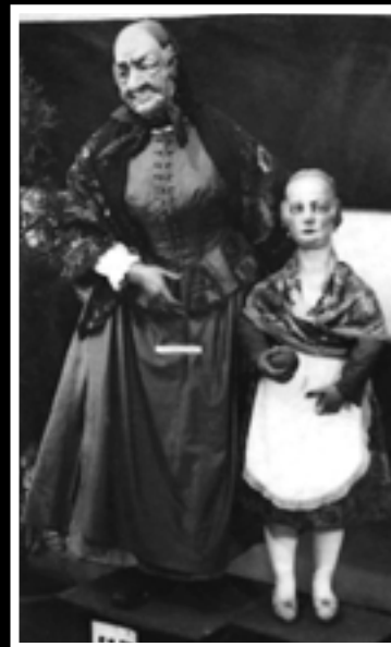
▲ Ninot indultat de 1934 en l'exposició del ninot.