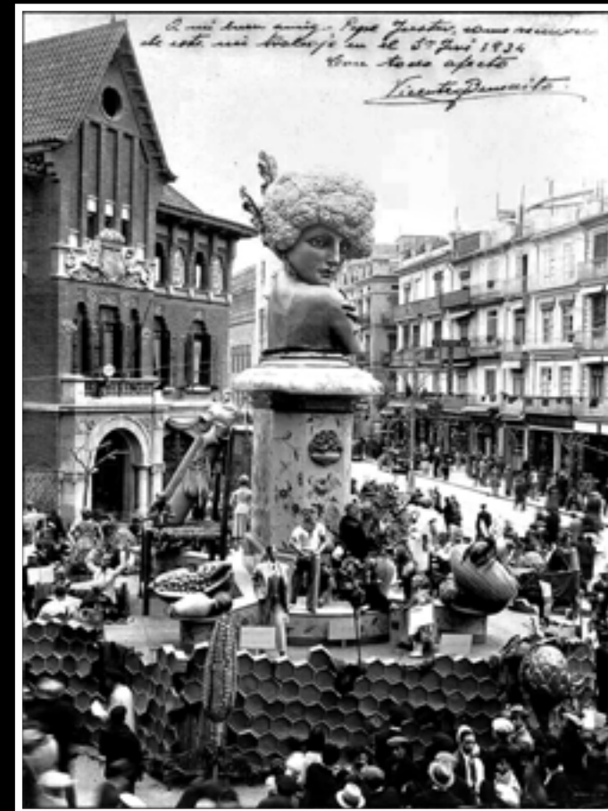
Mis Col, falla guanyadora al 1934. ▶ Plaça del Mercat Central. Artista: Vicent Benedito