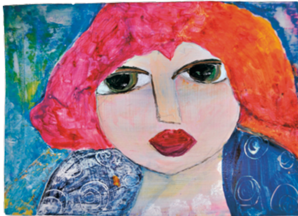
▲ Dibuix: Fina Caldes

Permeteu-me, però, que vos parle d'altre tipus de "tresors". Perquè no solament són materials, també existeixen els tresors que la nostra ment ha sigut capaç d'albergar i que ens fan més rics a mesura que passa el temps. Eixes imatges de moments viscuts que acudeixen de cop i volta per a recordar-nos que en algun temps en concret hem format part d'una situació o vivència, hem creat eixe moment individual o col·lectivament i l'hem patit o gaudit... sí, érem nosaltres, eixes imatges que entren per la retina i s'alberguen per sempre a la nostra ment i al nostre cor, són tresors immaterials, intangibles, són els tresors de la nostra vida, són tresors que el pas del temps no ha sigut capaç de diluir.