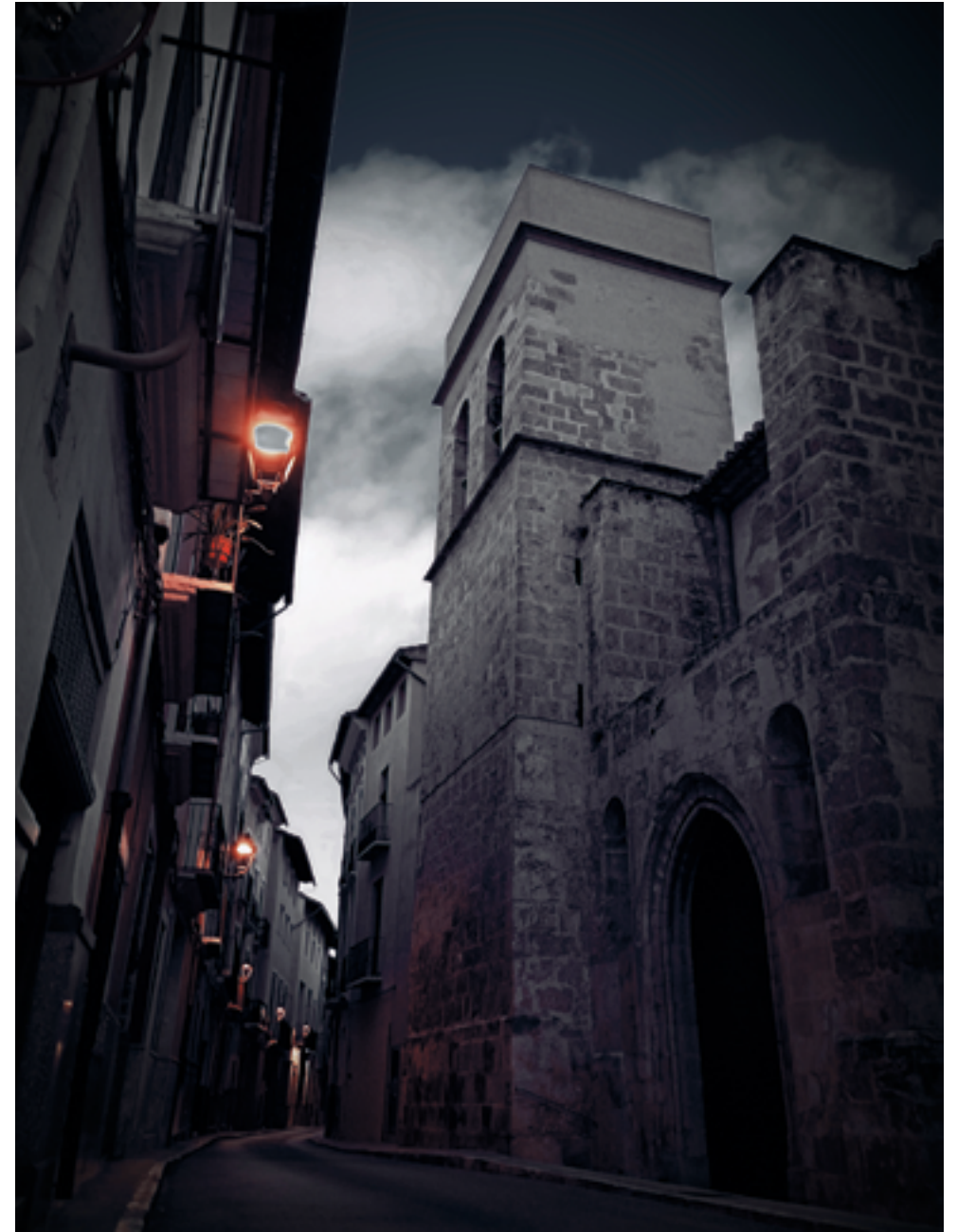
Església de Sant Pere.

Mai no ho pense i mai no ho sabré. Tanmateix, de tant en tant, enyore, m'alimente d'aquell encontre casual.