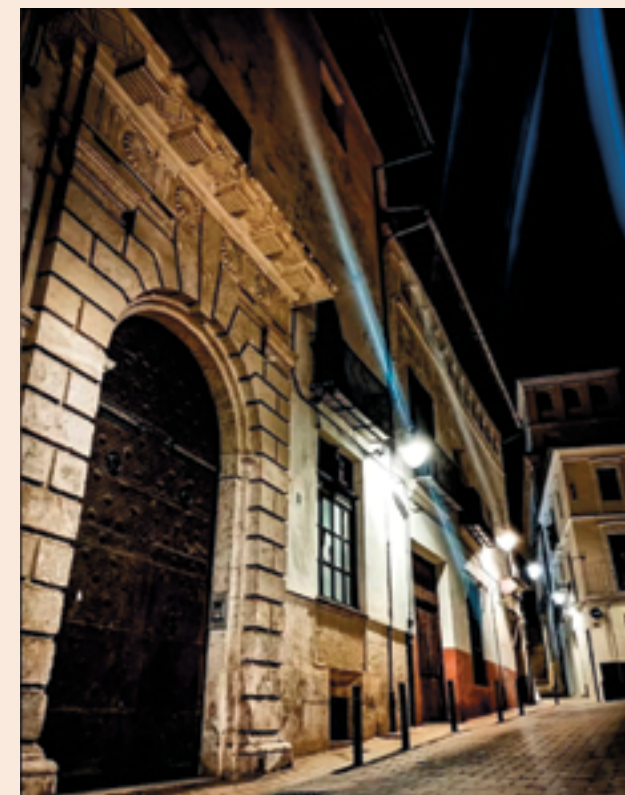
La portada barroca dels mercedaris enfront de la casa de l'inventor de la Taquigrafia

Davant, on hui es pot veure un edifici de vivendes amb balcons de forja, va estar l'antiga església de Santa Tecla, una de les parròquies més antigues de la ciutat. Arruïnada pels efectes de diversos episodis històrics com l'assalt a la ciutat en la Guerra de Successió Espanyola i el terratrèmol de 1748, hui només queda en peu d'ella, restes d'alguna dependència dins de la propera Casa de l'Ensenyança, hui Museu municipal de Belles Arts de Xàtiva, i la seua esvelta torre campanar d'antics carreus l'ombra de la qual, en determines èpoques, cau sobre la plaça, junt amb la bella font-fanal de forja i estil modernista, ubicada en el seu centre geomètric.